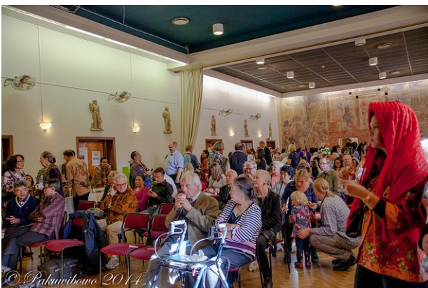
Pasar Malam 2014 på Alvik kulturhus, Bromma salen

Text: Kadri Chanafiah