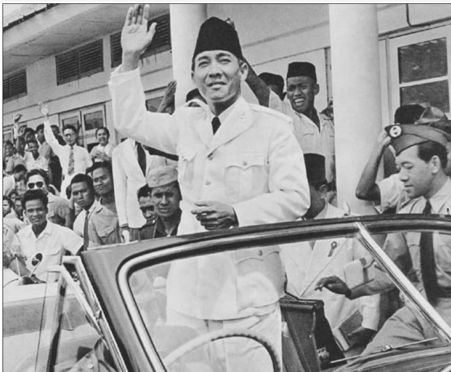
Sukarno - Indonesiens första president. Foto från slutet av 1940- eller början av 1950-talet.

Sukarno var en framstående indonesisk politiker. För 75 år sedan, den 17 augusti 1945, förklarade Sukarno tillsammans med en annan nationalistledare, Mohammad Hatta, Indonesien som en självständig stat. Sedan dess firas den 17 augusti som Indonesiens nationaldag.