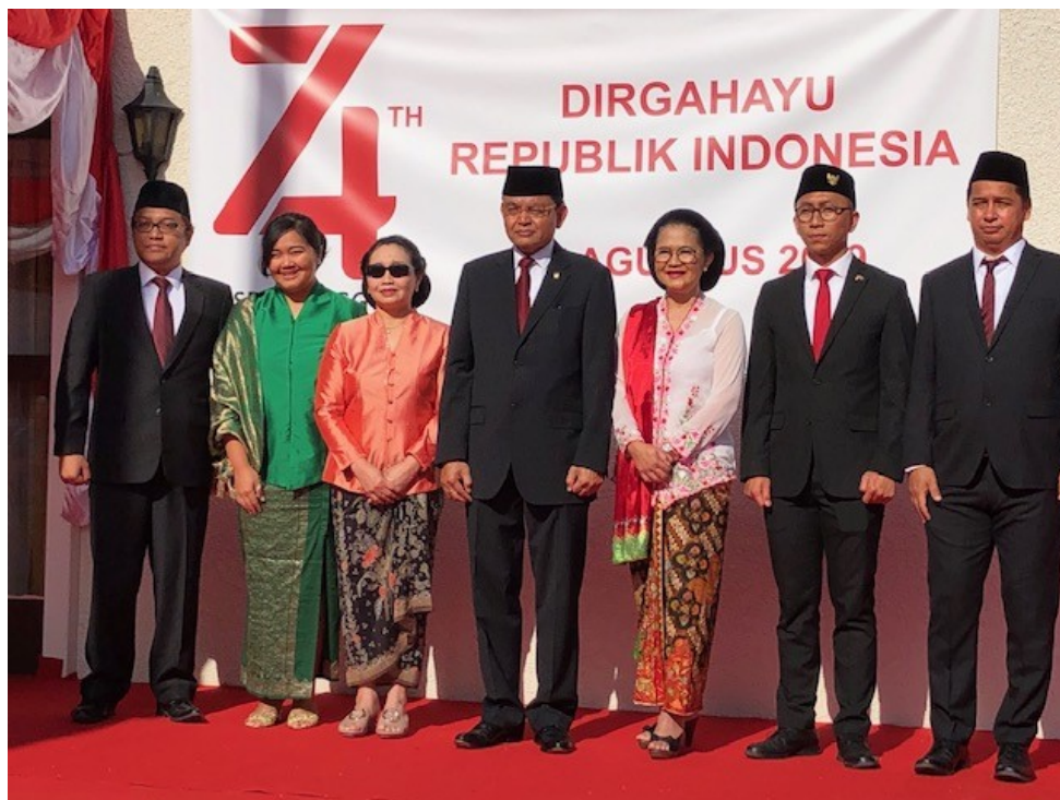
Indonesiens nationaldagsfirande 17 augusti 2019, ambassadörens residens på Lidingö.