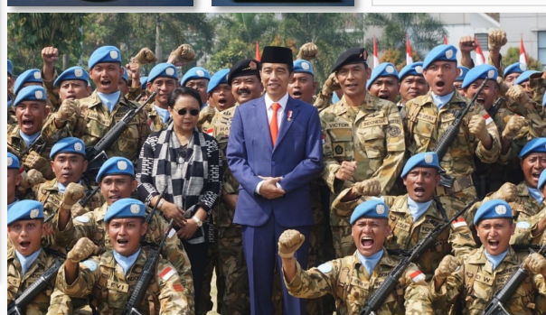
President Joko Widodo och utrikesministern Retno Marsudi med Garuda-kontingenter som ska i väg till Kongo och Lebanon.