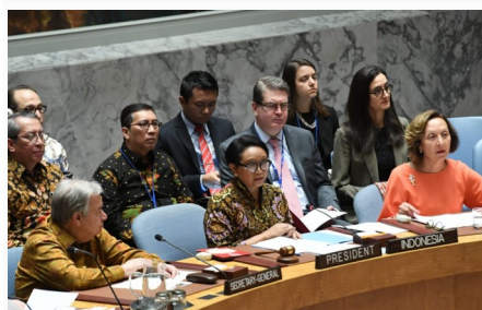
Indonesiens utrikesminister Retno Marsudi leder FN:s säkerhetsråds session.