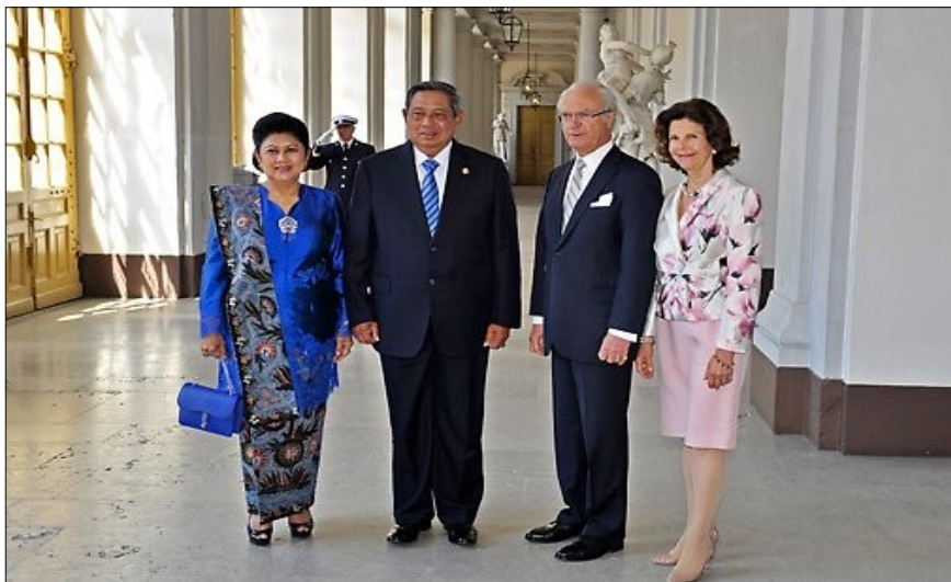
Kungäppet tog emot Indonesiens president Susilo Bambang Yudhoyono och fru Yudhoyono.

I år firar vi 70 år av diplomatiska förbindelser mellan Sverige och Indonesien. 1950 inrättades ambassader i både Jakarta och Stockholm.