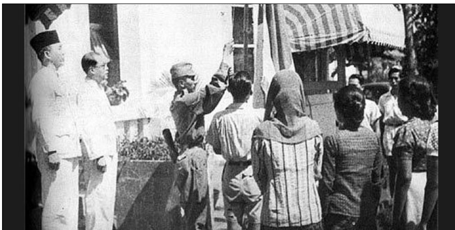
Ceremoni på Pegangsaan Timur 56 i Jakarta den 17 augusti 1945. Längst till vänster i bilden: Sukarno. Bredvid honom Mohammad Hatta.