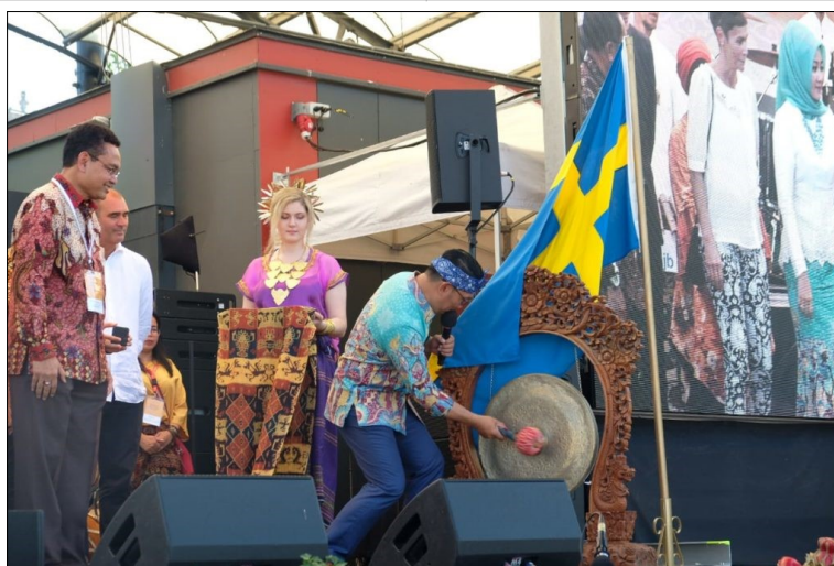
Guvernören för Västra Java Ridwan Kamil öppnar årets "Kampung Indonesia" genom att slå på gong gongen.

Årets upplaga av "Kampung Indonesia" är den tredje i ordningen. Den första 2017 hade jag missat helt och förra året hann jag bara till avslutningen. Tredje gången gillt! I år fick jag förtroendet att vara med i gänget som bistod ambassaden under festivaldagarna. Jag kunde avnjuta festivalen från morgon till kväll i hela två dagar. Det var som att ha jour med början kl 8 på morgonen och beordrad övertid till kl 9 på kvällen.