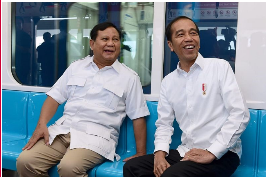
Prabowo, tv, och Jokowi på väg till köpcentret Fx Sudirman för en gemensam lunch.

Foto: okezone.com , text: Kadri Chanafiah