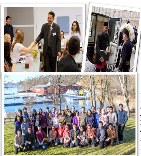
Från vänster till höger: Ambassadören besöker en högskola, överlämnar kreditivbrev till kungen och träffar studenter från Indonesien (PPI)

Sahabat: Varför är en god relation mellan Sverige och Indonesien viktigt?