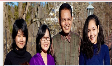
Ambassadören med familj

Ambassadören: Alla uppdrag skiljer sig från varandra och prioriteringarna skiljer sig från land till land. Exempel är att lära oss mer om regional säkerhet typ den som existerar i Balticum och mer om den svenska helhetsfilosofin att producera vapen samtidigt som man förespråka fred på jorden. Vi vill även veta mer om hur man producerar varor utan att förstöra miljön och hur man inför policies för detta.