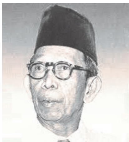
Raden Mas Suwardi Suryaningrat

politiskt parti kallat Indische Partij. "Nederländska Indien för alla!" blev partiets slagord. Partiet hade som syfte att kämpa för lika rättigheter för alla invånare i Nederländska Indien oavsett ursprung, då den ursprungliga befolkningen under